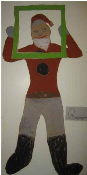
Eitt þeirra verkefna sem unnin voru á þemadögum. Þetta er karlinn hann Gluggagægir.

jólasveina, Grýlu, Leppalúða og jólaköttinn úr maskínupappír og