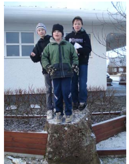
Þrír úr 8. bekk á steini.

Ratleikurinn fólst í því að nemendur áttu að hlaupa um nágrennið með stafræna myndavél og taka myndir af vissum hlutum eða hópnum að gera ákveðna hluti. Hver árgangur kom svo saman og skoðaði afrakstur hvers hóps. Myndir frá deginum er að finna á heimasíðunni www.heidarskoli.is en meðfylgjandi eru nokkrar myndir úr ratleiknum.