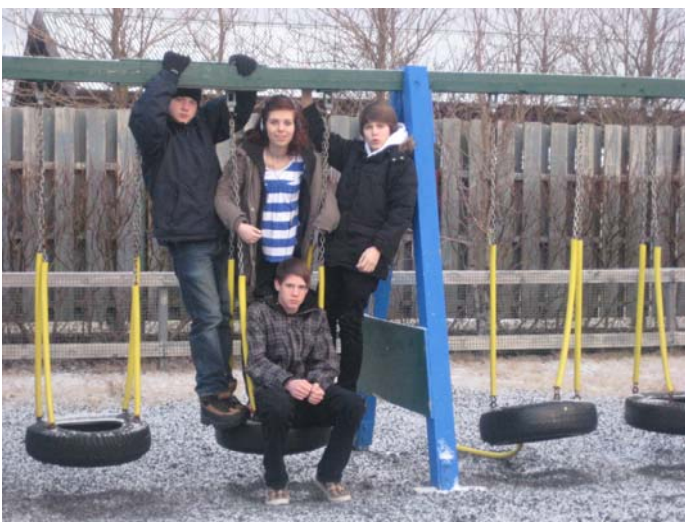
Hópur í 10. bekk. Fjórir saman í rólu sem er ekki á skólalóðinni.