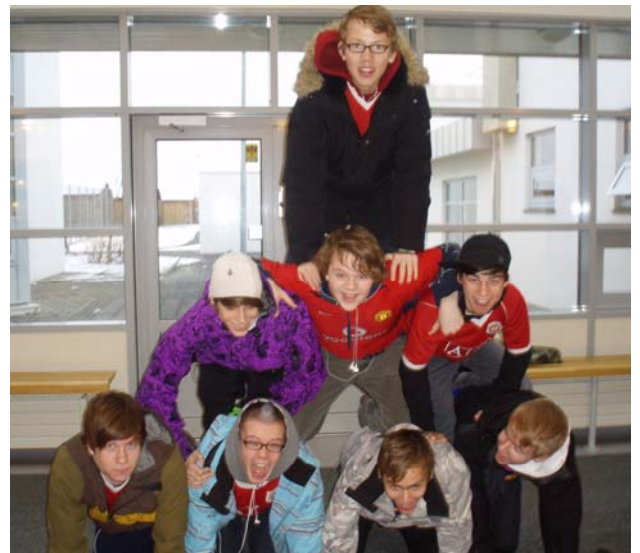
Hópur úr 9. bekk. Allur hópurinn í pýramída.