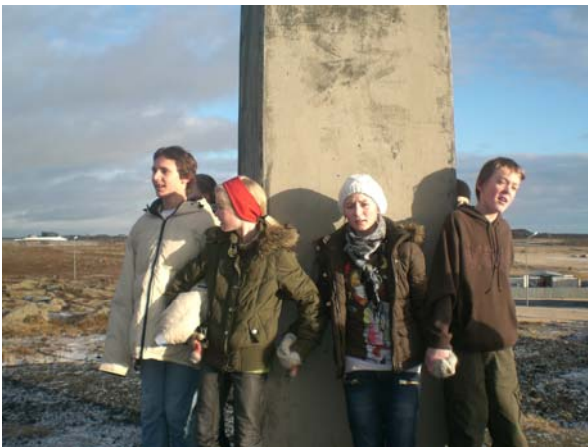
Hópur úr 7. bekk hjá Mánahestinum

Þann 21. febrúar var íþróttadagur í Heiðarskóla. Nemendur í 1. - 3. bekk komu í íþróttahúsið og fóru í Tarzanleik. Nemendur í 4. - 6. bekk spiluðu bandý og brennó í íþróttahúsinu og nemendur í 7. - 10. bekk tóku þátt í skemmtilegum ratleik.