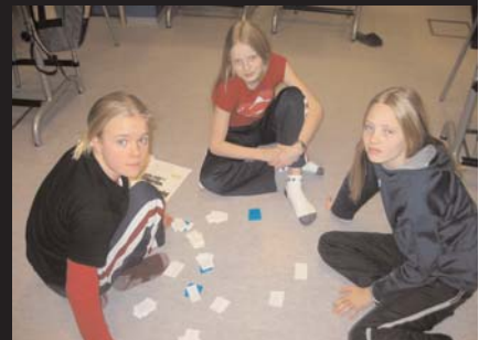
Stúlur í 7. bekk EE vinna við gerð hugtakakorta

Vinnan fer þannig fram að nemendur lesa texta úr t.d náttúrufræði og skrá niður hjá sér orð sem þau muna og raða þeim síðan út frá grunnhugtaki þannig að þau eru í rökréttu samhengi.