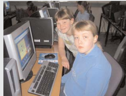
Stúlkur úr 5. bekk HT vinna á nýju tölvurnar.

Í febrúar voru tölvur í tölvuveri Heiðarskóla endurnýjaðar. Það er mikill munur fyrir nemendur og kennara að fá hraðvirkar og nýjar tölvur til að geta nýtt þær til náms og kennslu. Nokkrir árgangar eru með fasta tíma í tölvuveri en annars geta ken-narar skráð sig í tölvuverið með bekkni sína annaðhvort með tölvukennara eða án. Þannig er hægt að nýta tölvutímana til að vinna með það efni sem verið er að læra í öðrum náms-greinum.