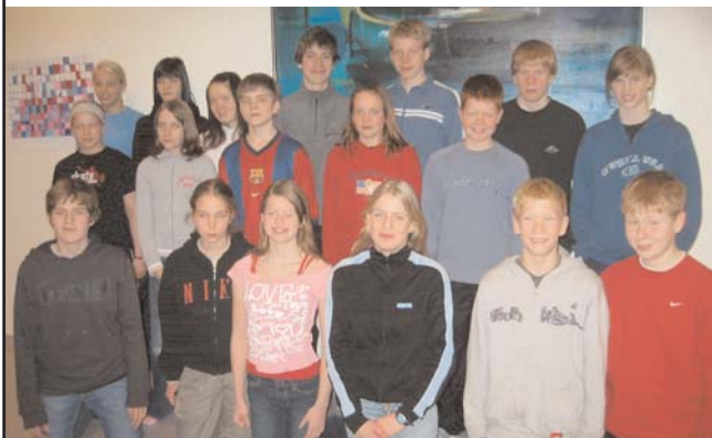
Hópurinn sem tók þátt í verkefninu á vorönn

Verkefnið er ætlað nemendum fæddum 1989 - 1992 er þykja skara fram úr í námi. Frá því í janúar hafa 19 nemendur frá Heiðarskóla sótt námskeið hjá Háskóla Íslands ásamt öðrum grunnskólanemum. Þeir völdu sér fjölbreytt viðfangsefni s.s. lögfræði, frönsku, hjúkrun og útvarpssmíði. Nemendur segjast vera mjög ánægðir með þetta verkefni sem er bæði krefjandi og skemmtilegt.