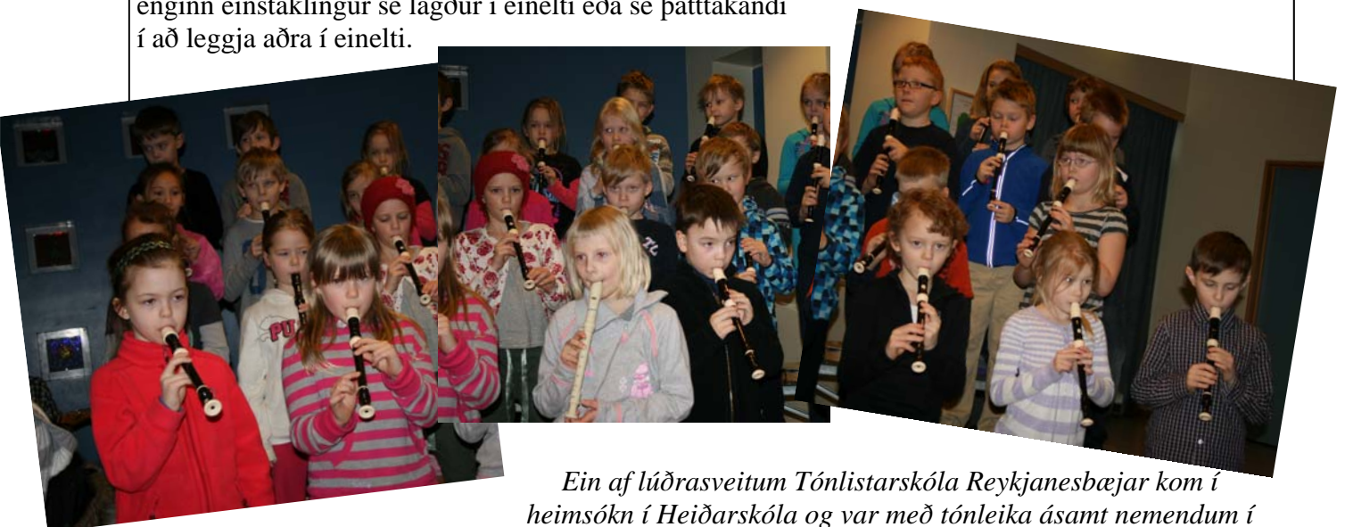
Ein af lúðrasveitum Tónlistarskóla Reykjanesbæjar kom í heimsókn í Heiðarskóla og var með tónleika ásamt nemendum í 2. bekk sem sungu og spiluðu á blokkflautur.