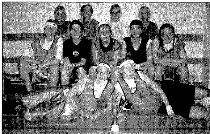
Kjarnorkukonur. Komu sáu og sigruðu fyrir hönd Heiðarskóla.

Langar okkur því hér í Heiðarskóla að koma því á framfæri að textílkennarar taka á móti tölum, garni, efni og öllu sem tengist textílkennslu sem ekki nýtist heima fyrir. Gefum garninu líf.