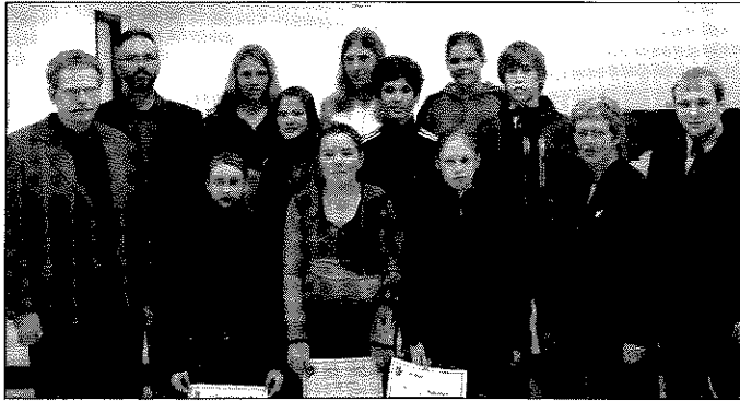
Vinningshafar ásamt aðstandendum keppinnar í FS.