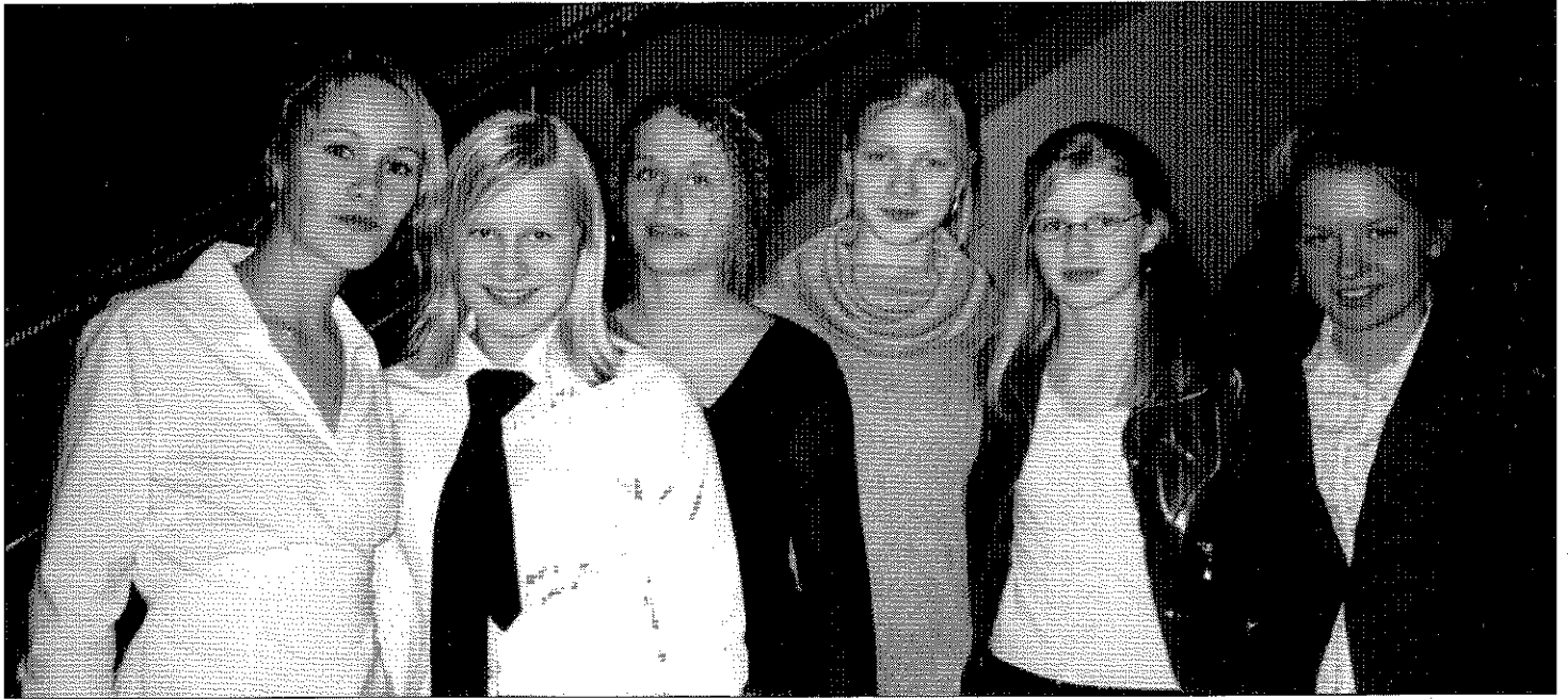
Hér má sjá nokkrar stúlkur úr Heiðarskóla í sínu finasta þússi á sýningunni.