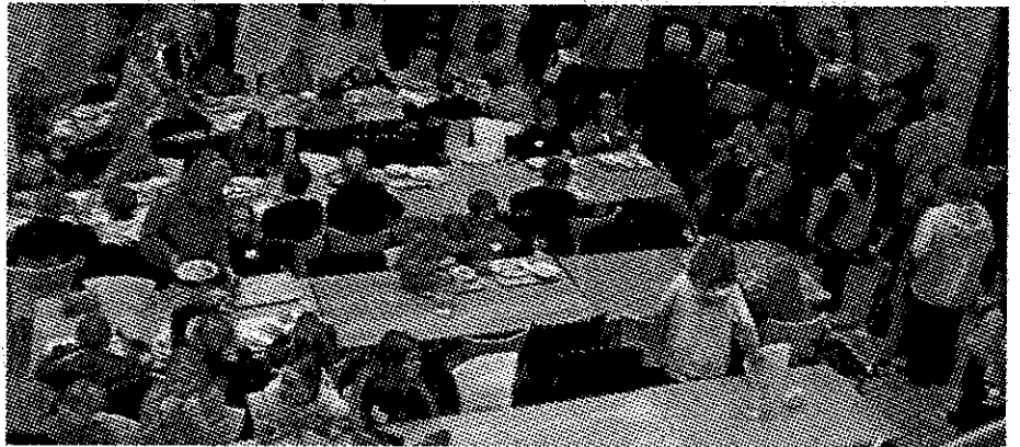
Myndin er úr matsal

Í dag hófust samþættingardagar í Heiðarskóla. Munu þeir standa yfir dagana 26-30 nóv. Tekið skal fram að allt efni sem birtist í þessu blaði er eingöngu eftir nemendur Heiðarskóla. Á þessum dögum verður brotið upp allt skólastarf í skólanum og verður í staðinn öllum skólanum skipt í svokallaðar smiðjur t.d. fjölmiðlasmiðju en þar var þetta skólablað unnið. Svo verða fleiri smiðjur eins og íþróttasmiðja en þar verður farið í líkamsræktarstöðina frægu, Lífstíl. Eftir það verður farið í Íþróttahúsið við Holtaskóla, síðan slakað á í sundi og heitum pottum. Þá verða svokallaðir „Bland í poka“ hópar en þar var hægt að velja Bland í poka 1 og Bland í poka 2 en í þeim hópum