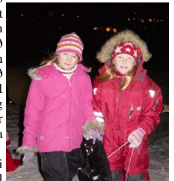
Þessar stúlkur í 3. bekk eru klæddar eftir veðri.

Klæðið börnin eftir veðri það er nefnilega ekki til vont veður bara óhentugur klæðnaður.