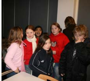
Nemendur í 5. KG koma úr Stjörnuverinu