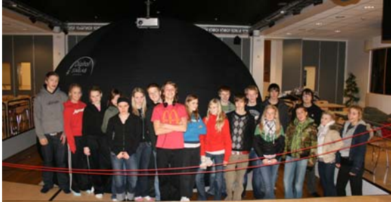
Nemendur í 10. RR fyrir framan Stjörnuverið í sal Akurskóla

Í janúar fóru nemendur í 5. og 10. bekk í skemmtilega ferð í Akurskóla. Allir grunnskólarnir í Reykjanesbæ höfðu sameinast um að fá í heimsókn svokallað Stjörnuver. Stjörnuverið er stór uppblásin hálfkúla sem nemendur fara inn í og er myndum varpað í loftið. Nemendur fá svo fyrirlestur um himingeiminn ásamt því að sjá stjörnur og önnur fyrirbæri á himninum frá ýmsum sjónarhornum og á hreyfingu.