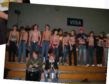
Stuðningsmenn Heiðarskóla voru líflægir á pöllum