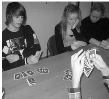
Nemendur í 9. bekk spila Phase 10