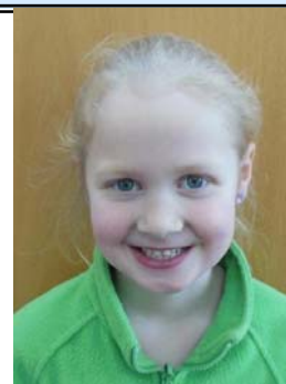
Raket Rán, 1. AJ